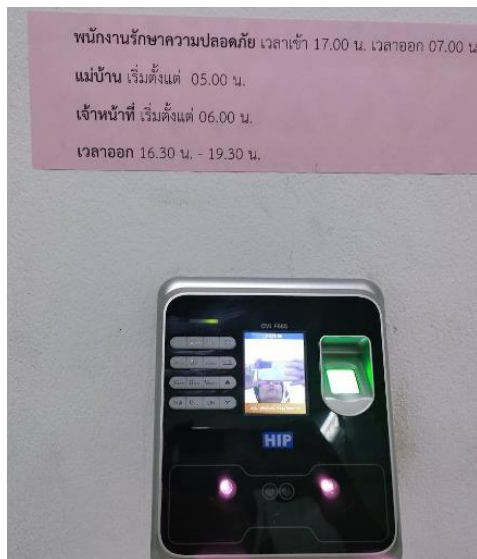
เครื่องลงเวลาการปฏิบัติงาน

๒.๒ การใช้ระบบ AMSS++ ในการปฏิบัติงาน เช่น การแจ้งภารกิจผู้อำนวยการสำนักงานเขตพื้นที่การศึกษา การลงทะเบียนหนังสือราชการ การรับส่งหนังสือราชการ การบันทึกข้อความ การรับส่งหนังสือผ่านไปรษณีย์ การจองห้องประชุม การใช้อานพาหนะ การปฏิบัติราชการ การขออนุญาตไปราชการ การลา การเก็บเอกสาร เป็นต้น