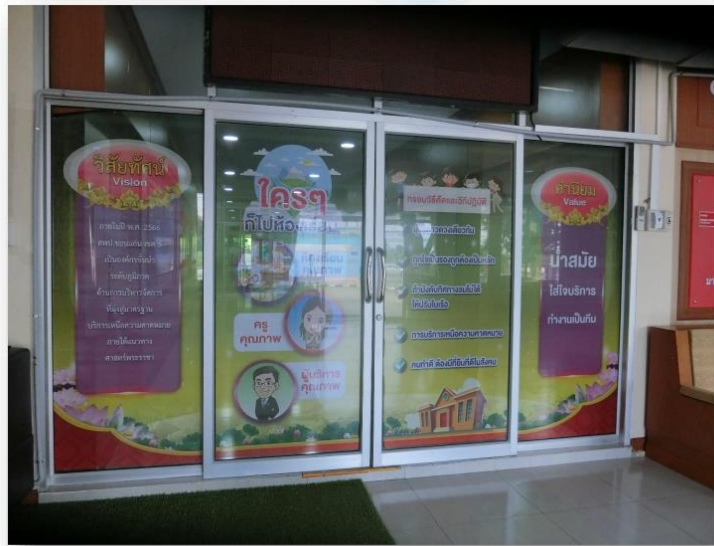
ภาพป้ายแสดงค่านิยมขององค์กรหน้าประตูสำนักงานเขตพื้นที่การศึกษาประถมศึกษาขอนแก่น เขต ๕

๕. คนทำดีต้องมีที่ยืนในสังคม โดยได้จัดทำกรอบวิธีคิดและวิถีปฏิบัติติดไว้ที่ทางเข้าสำนักงานเขตพื้นที่เพื่อย้ำเตือนข้าราชการครู และบุคลากรในสังกัดให้นำไปปฏิบัติให้เกิดขึ้นอย่างแท้จริง