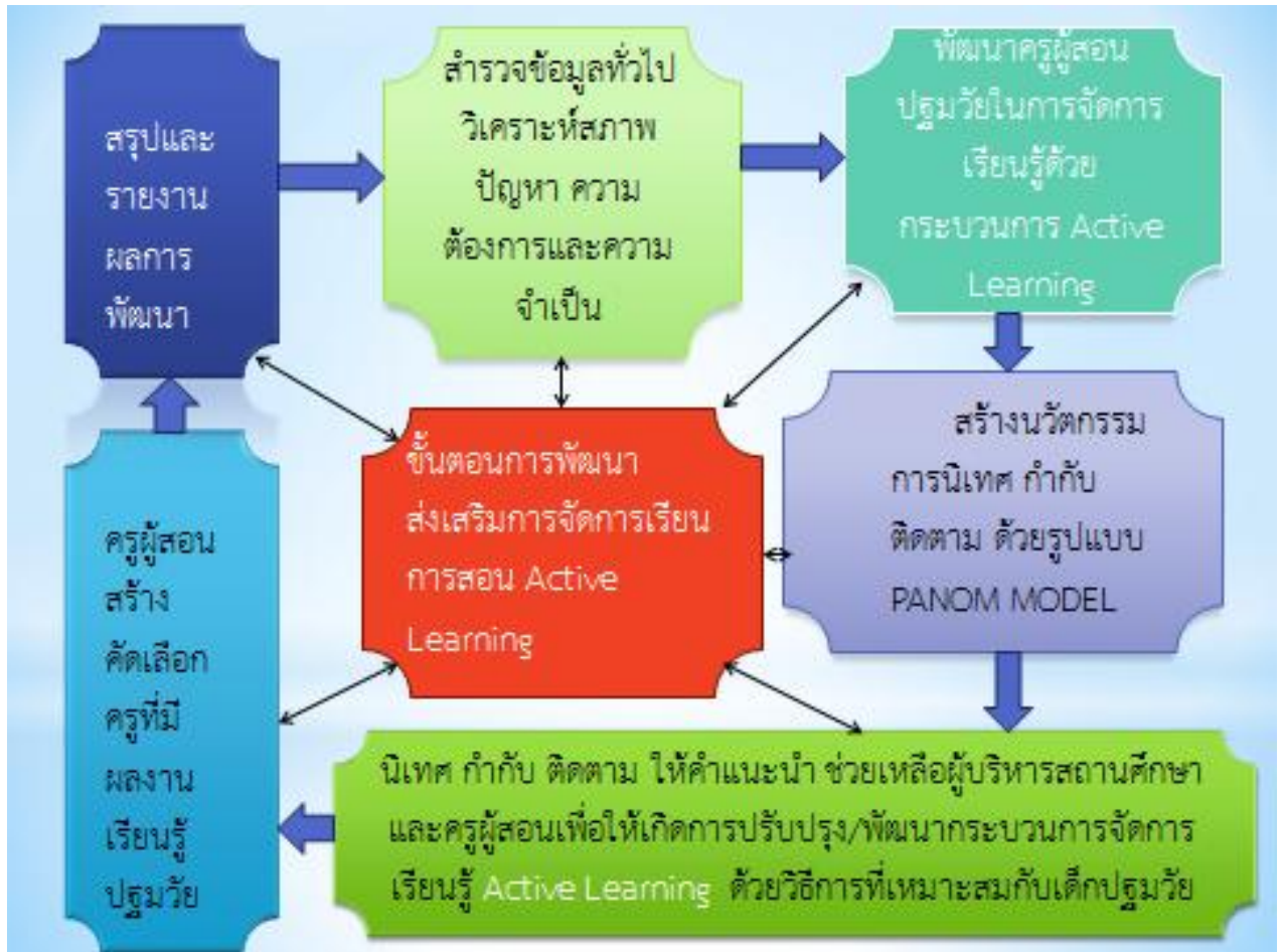
ภาพที่ 2 แสดงขั้นตอนการพัฒนาครู ด้วยกระบวนการ Active Learning